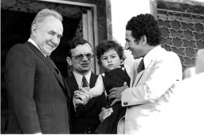
جانب من زيارة رسمية لرئيس مجلس وزراء الاتحاد السوفياتي أليكسي كوسيجن لليبيا، وفي استقبله عبد السلام جلود، 12 / 5 / 1975.